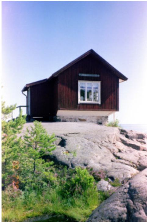
Ateljéns södra gavel

undrar om vi kanske därför ”kan allt” om Albert Engström. Vi försäkrar att vi trots vår bostadsort känner oss i behov av mer kunskaper om Engström, och hon fortsätter berättandet. Innan vi går investerar vi också i ett faksimilexemplar av ”Strix”, samt några vykort.