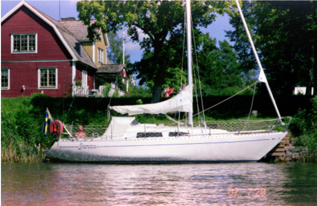
.....och förtöjer längsides den lilla träbryggan vid stranden