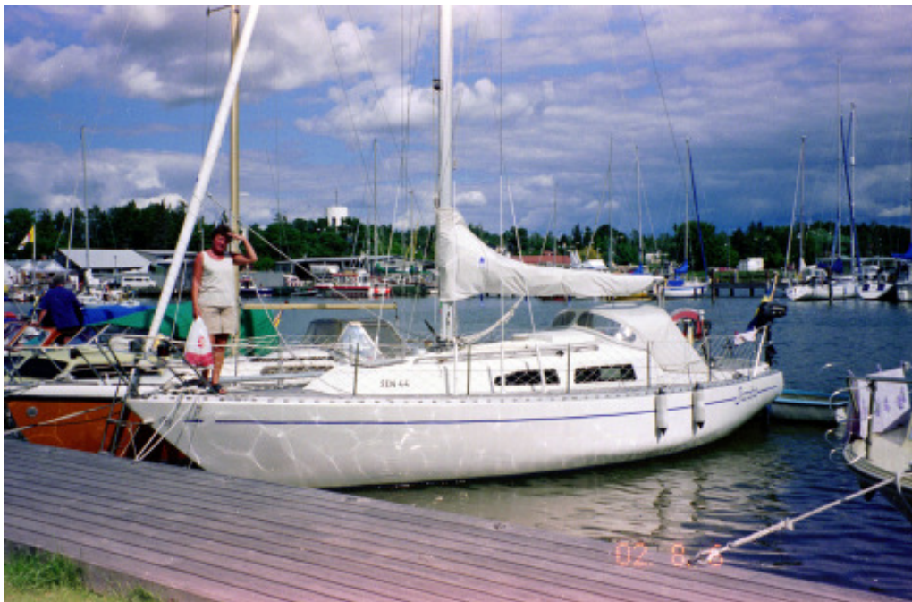
Janita vid gästbryggan i Trosa

Nyköpings Segelsällskaps klubbholme, något längre västerut vid den vanliga leden. Nu går vi i stället snart genom den smala passagen mellan stora och lilla Lökholmen. Vinden ligger nu nära syd, så vi kan med ett nödrop ta oss igenom det sundet utan att behöva slå. Nästa waypoint är kumlet utanför Stora Trässö. Oxelösunds höga skorstenar har vi då bara några få distansminuter innanför oss om styrbord.