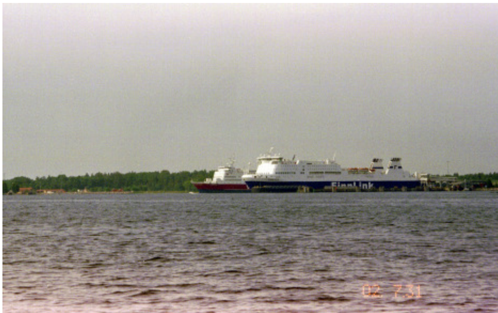
Färjorna vid Kapellskär.

Klockan halv tio följande dag lättar vi ankar och seglar söderöver i ett fantastiskt väder. Vi har snart Tjockö på vår babordssida, och något senare finns Kapellskär om styrbord. Inne vid kajerna här ligger ett par av de stora färjorna som trafikerar rutterna till Åland eller egentliga Finland. Kapellskär är ju en gammal känd ”sista utpost” mot öster.