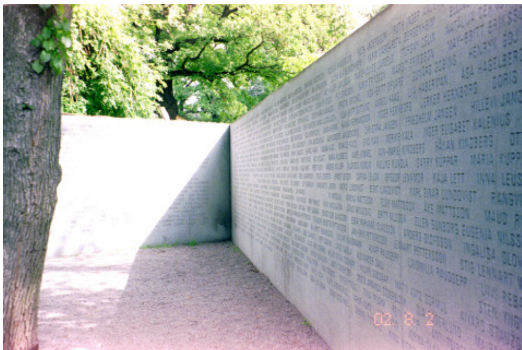
Estoniamonumentet i anslutning till Galärkyrkogården på Djurgården. Samtliga de omkomnas namn finns ingraverade på dessa väggar