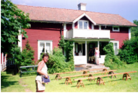
Albert Engströms bostad i Grisslehamn. Hustrun i förgrunden