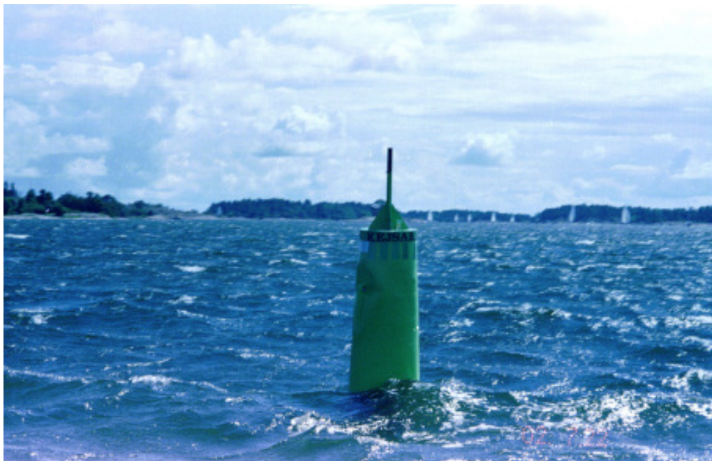
”Kejsaren”, ett välkänt sjömärke i södra delen av Aspöjafjärden

Sommaren 2002 kommer sannolikt att gå till hävderna som en enastående seglings-sommar. Särskilt den som hade lyckan att få sin semester förlagd till den senare delen av sommaren fick sitt lystmäte av sol och värme. Redaktionen med hustru inledde semesterseglingen i slutet av juli. Här presenteras för Wiking-Runans läsare första delen av den sannfärdiga berättelsen om denna seglats.