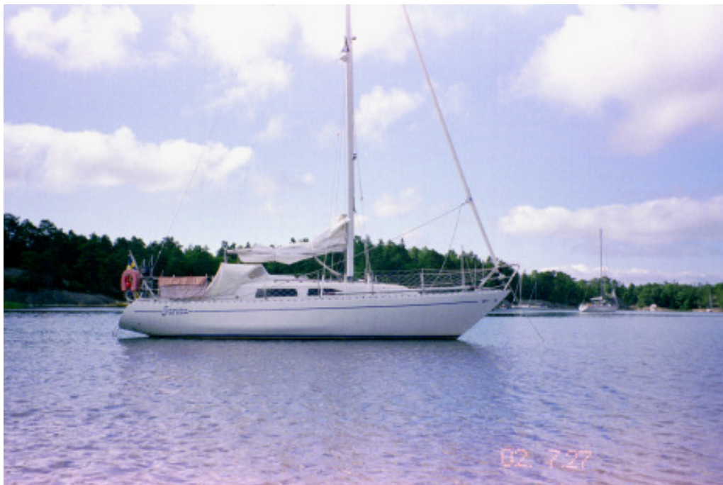
Janita för ankar i "Paradiset"

Den är nu försedd med peke i fören och har tydligen också numera inombordsmotor, för ingen snurra syns på aktern. Vi är för långt ifrån för att ropa till besättningen, och det skulle bli en sådan stor procedur att vända om och gå ifatt dem att vi inte gör det, men jag får en klump i halsen och det är nästan så att en tår tränger sig fram i ögonvrån, när jag tänker på alla upplevelser vi hade under åtta somrar med just den båten.