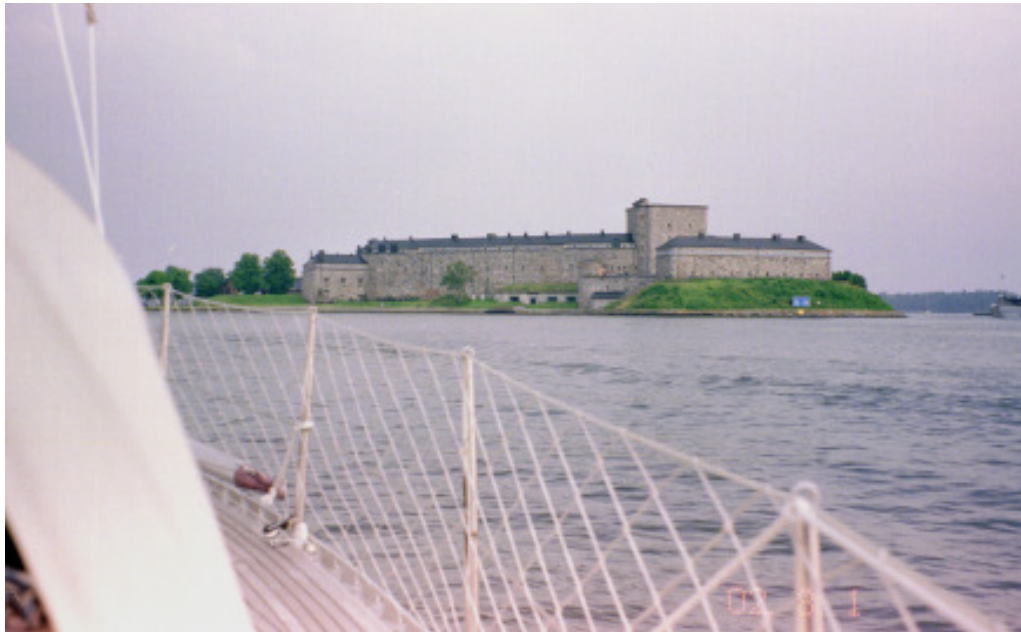
Vaxholms fästning - norrifrån