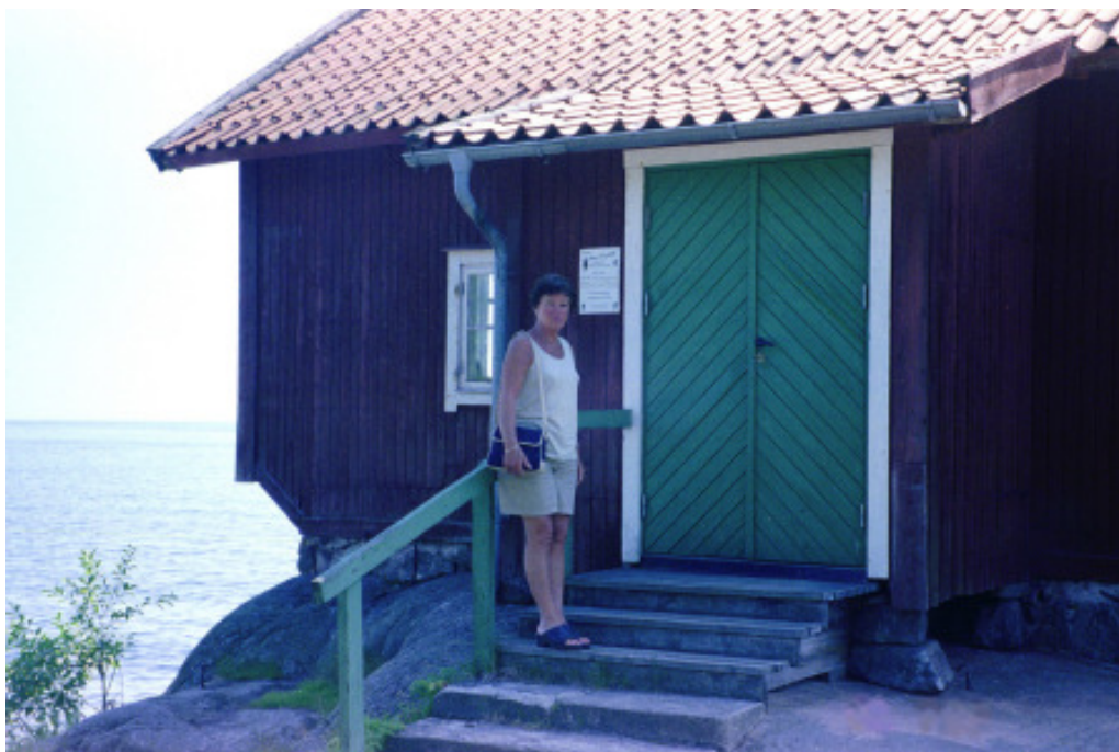
Hustrun vid entrén till ateljén

döljer slutligen den nedgående solen, innan den hinner ner till horisonten. Vi känner oss tillfreds med att utan missöden ha nått fram till slutmålet för denna segling, och vi häpnar över insikten att vi har kommit ända hit (enligt loggen 204 distansminuter) utan att behöva göra ett enda krysslag. Vindarna har alltså hela tiden legat på syd, och vädret har generellt varit alldeles fantastiskt. Badvattnet har varit 22 grader varmt eller mer!