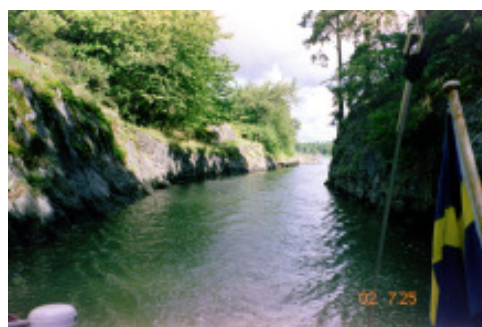
En titt akteröver, när vi går genom "Draget"

Efter Öja faller vi av in mot Järflotta och går in i Dragets Kanal. Vi går sedan in i den smala vassomgärdade viken norrut