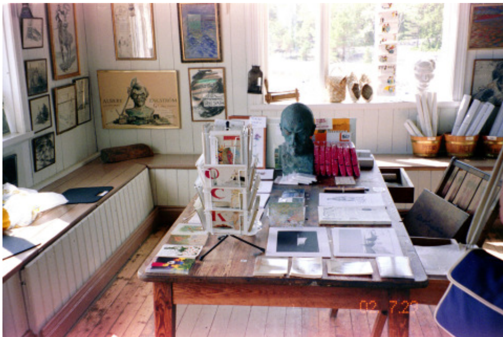
Ateljén - interiör

Ganska nöjda med dagen så här långt och fyllda av en massa intryck och associationer till Albert Engström som person, vandrar vi slutligen också till museet nere vid hamnen. Där kan vi dels beskåda en konstupställning i de nu bastuvarma lokalerna, men framför allt kan vi betrakta en hel del möbler och inredningsdetaljer som skall ha varit Engströms privata bohag.