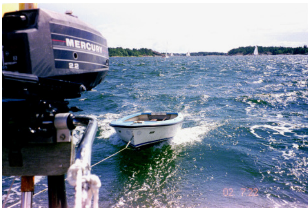
Jollen planar i den friska vinden

Dagen därpå lättar vi så ankar strax före tolv, efter bad och frukost. Vi går ut i leden igen och fortsätter norrut. Det är toppenväder, och den sydliga vinden friskar något, så efter en stund kan vi tidvis logga över 7 knop. Efter tre timmar passerar vi den välkända pricken ”Kejsaren”. Jag tar upp kameran för att få en bild på den ljusgröna plastcylindern med det imponerande namnet. Vid första försöket får