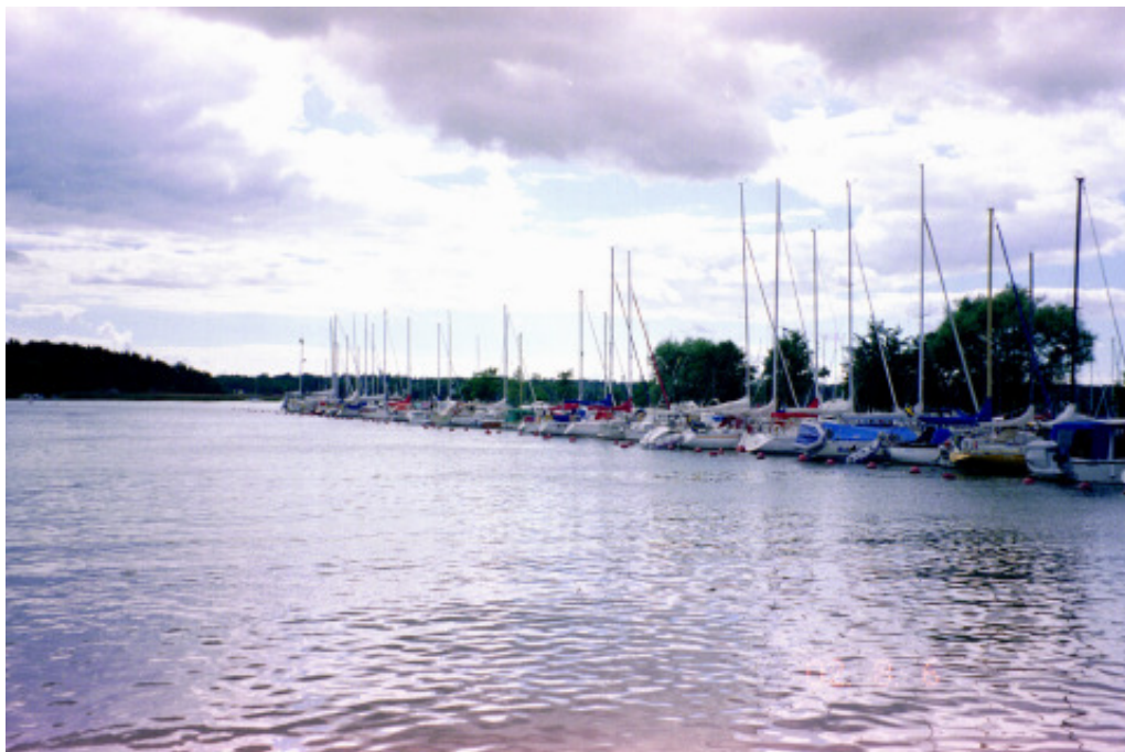
Trosa gästhamn - vid Trosaåns utlopp

Vi kan sträcka nästan hela vägen, men får göra ett par slag i slutet av Boköleden. Går sedan utanför den prickade leden och väster om öarna vid Kockelskär, med minsta möjliga marginal mot den lilla ön på läsidan, utan att behöva göra något slag. Kan sedan sträcka för babords halsar mellan Hökö Gupa och Gupan, innan vi styr ner mot Sävsundet.