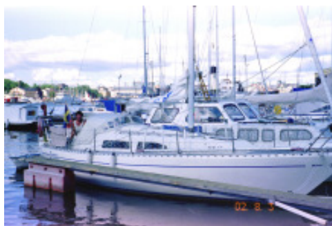
Janita i Vasahamnen

Efter övernattnings, handling av färskvaror, samt bunkring av såväl diesel som vatten går vi följande dag klockan 13.40 från bryggan i Trosa och kör motor ut genom den långa viken mot öppet vatten. Ute vid fyren "Julaften" (se föregående Runas omslagsbild!) hissar vi sedan fullt ställ och seglar.