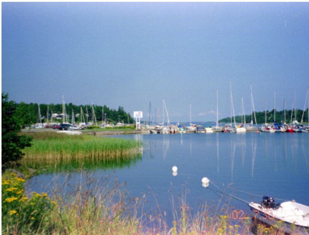
Vy västerut mot gästbryggan där Janita ligger

(position N 59.46,418 – O 19.04,631). Lidön ligger alltså strax söder om mer kända Arholma och alldeles utanför Norrtäljevikens mynning.