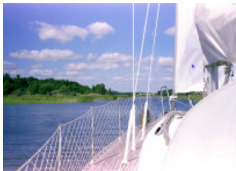
Vi går in i Vaddö Kanal

Efter bad och frukost lämnar vi följande dag Paradiset kl.09.45. Vi går ut i leden och fortsätter norrut. Litet mulet, men fortfarande sydlig vind. Det klarnar också upp alltmer under dagen och blir mycket varmt. Tyvärr avtar då också vinden, så vi får ta motorn till hjälp några gånger, när framfarten annars blir alltför dålig. Ovanför Kapellskär har vi emellertid glädjen att segla om en B 31:a – alltså en båt i vår egen storlek.