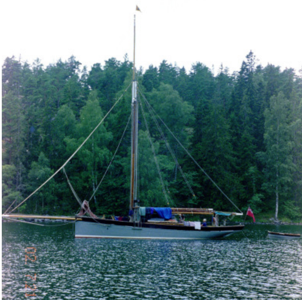
En engelsk gammal kutter kommer in efter oss och ankrar upp strax intill.....

för att verkligen hinna njuta av den. Går man utomskärs och seglar dygnet runt, så kan man förstås vara framme på ett par dagar, eller ännu mindre, beroende på väder och vind. För vår del skulle det visa sig att den effektiva seglingstiden blev drygt 50 timmar (enligt den sorgfälligt förda loggboken).