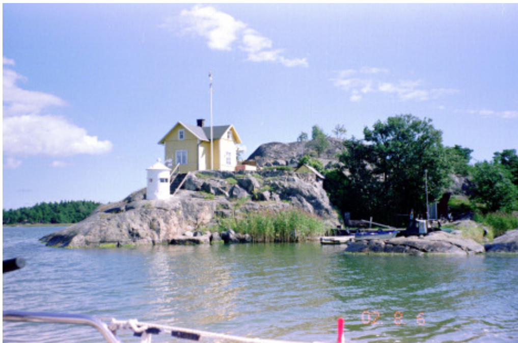
Julaftons fyr utanför Trosa

väljer vi att ta ner seglen och gå för motor genom det smala sundet vid Horvelsö och söderöver. En Albin Nova framhärdat i det längsta och kryssar i den nu riktigt friska sydliga vinden, men till slut väljer den också motorgång i den här ganska snäva farleden och tar ner sina segel.