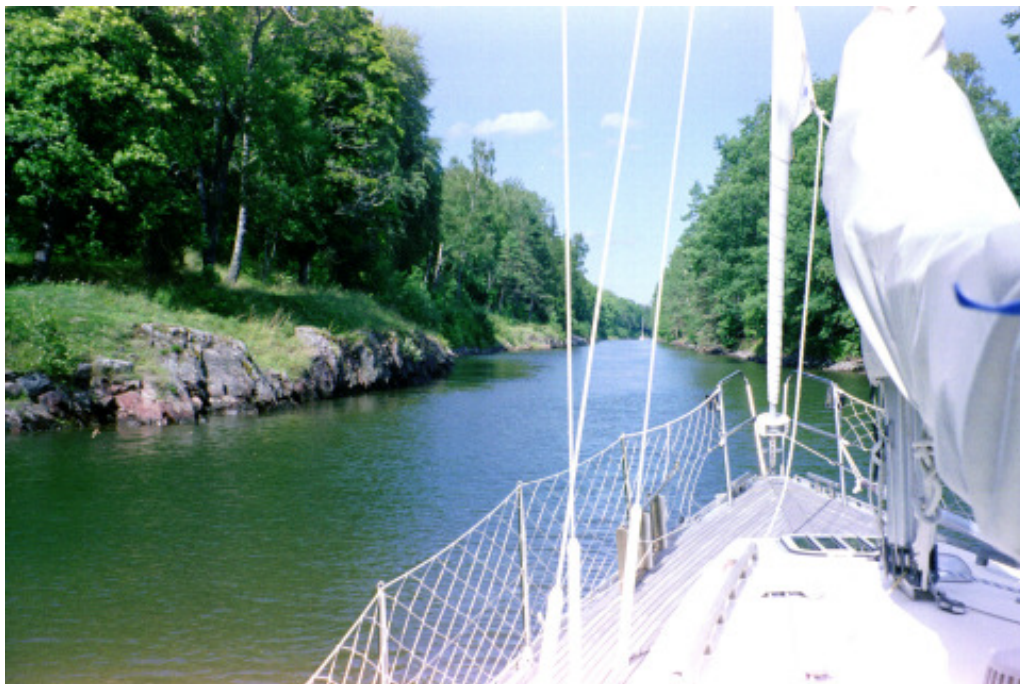
På väg norrut genom Väddö Kanal - mot Grisslehamn

Strax före sex på kvällen ankrar vi sedan upp i den lilla viken på norra ändan av Vätö om babord efter dryg motorgång över Lidöfjärden. Ankarplatsens position är enligt vår Garmin navigator: