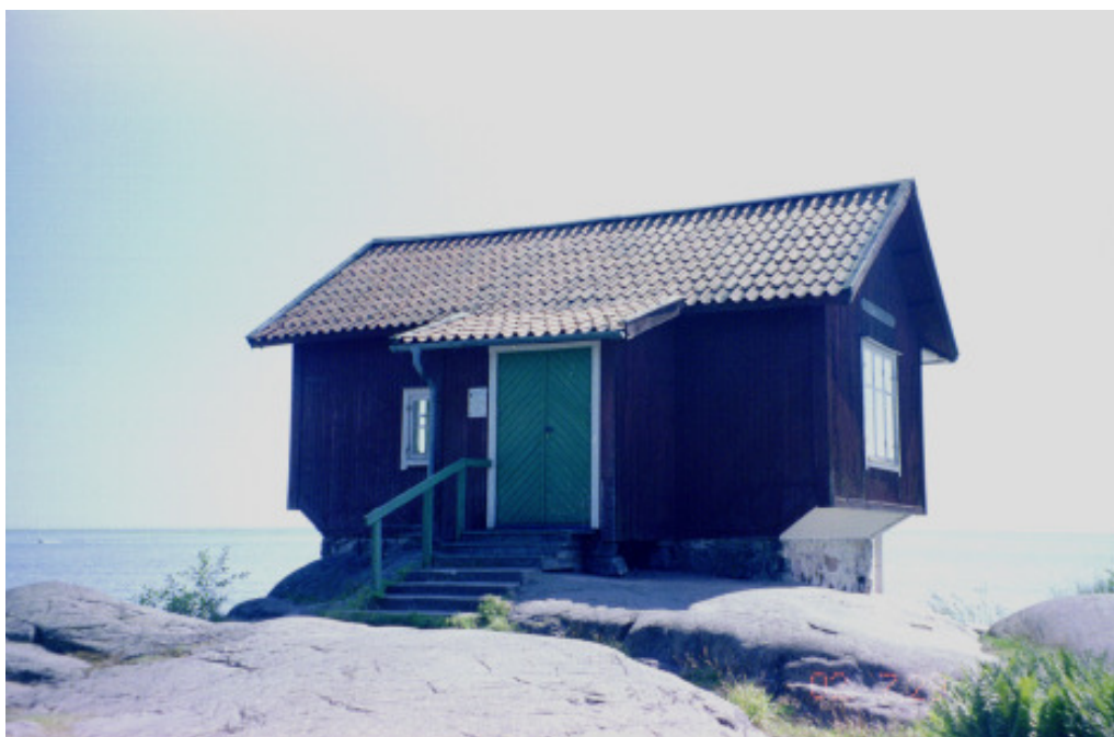
Albert Engströms ateljé vid Grisslehamn - en ensam utpost mot Ålands hav

När vi nu går i land i västra hamnen i Grisslehamn - efter att alltså ha uppnått vår planerade destination för årets semestersegling - är det inte alldeles enkelt att uppfatta var någon form av "hamnkontor" finns, var man t.ex. kan betala hamnavgiften. Till sist förstår vi i alla fall att denna funktion finns i en liten butik intill. Vi betalar direkt för två nätter (125 kr per dygn, inkl. el) och får upplysningar om var närmaste affär finns. Eftersom det nu är söndag, så har denna tyvärr just stängt. Och i den lilla "hamnbutiken" är man av naturliga skäl inte särskilt väl sorterad. Man har t.ex. inte någon fryst mjölk, som vi behöver till vår kylbox. Däremot får vi lägga in två liter för infrysning. Eftersom vi ligger så långt ut på bryggan, och inga eluttag finns annat än inne vid land, så får vi också låna en lång förlängningssladd, som tillsammans med vår egen på tjugofem meter räcker mellan båt och uttag.