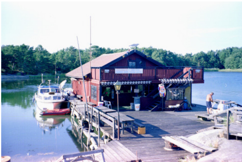
Tures Udde på Harstena

båt av typ Albin 23 har lagt sin ankarlina över vår, så när vi går ut måste jag också lyfta upp hans ankare för att få loss vårt. Besättningen har lämnat båten, så vi kan inte meddela oss med den, men det är lugnt här inne och nästan ingen vind, så det betyder inte så mycket att hans akterförtöjning nu blir slack och borde ”tajtas upp”. Det kan besättningen åtgärda, när den kommer tillbaka till båten.