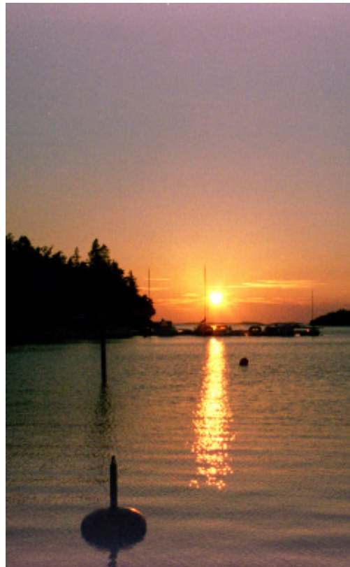
En vacker solnedgång, sedd från Grisslehamns gästhamn

Till sist är vi i alla fall lyckligt och väl förtöjda – och framme vid vårt slutmål denna semester. Märkligt nog känner ingen av oss igen något från vårt förra besök här 1985, trots att så vitt vi förstår knappt något väsentligt har förändrats. Det är uppenbarligen i stället vårt minne som är bristfälligt.