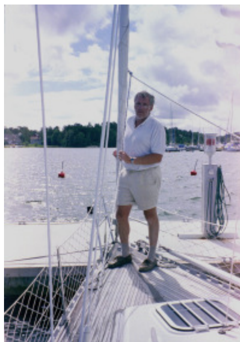
Skipper på Janitas fördäck, Nynäshamn