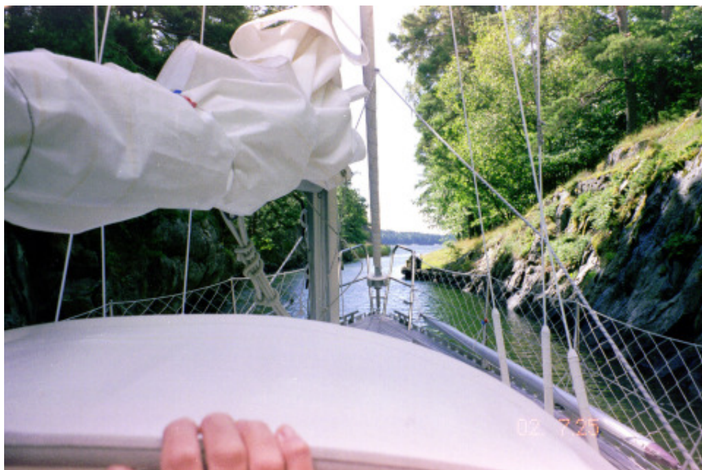
"Draget" - den sprängda delen av inomskärsleden till Nynäshamn söderifrån